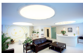
Salle d'attente Plafond lumineux mur imprimé

En outre, Ils sont exempts de matières cancérogènes (CMR) et n'émettent aucun composé volatil (COV) dans l'air intérieur. Leur installation à froid et à sec, propre et sans nuisance est un atout supplémentaire dans ce type d'environnement.