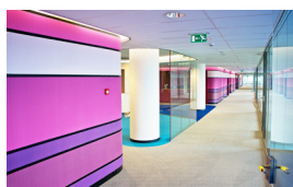
Couloir d'hôpital Mur imprimé