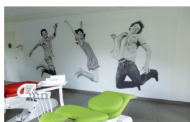
Cabinet dentaire Mur imprimé